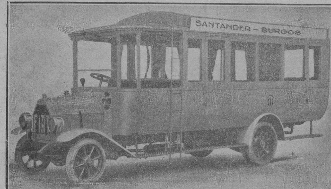
Uno de los magníficos automóviles con que hoy se inaugura la línea de Santander a Burgos.

Componen la caravana cuatro grandes ómnibus, capaces para veintisiete personas cada uno, y un camión, en el que irá la gasolina y enseres necesarios para tan interesante viaje.