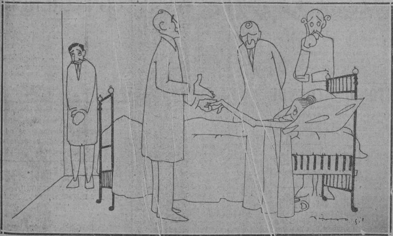
EL MEDICO.—Siempre recurren ustedes a mí demasiado tarde. Sin embargo, creo que extirpándole la rémora banderiza de que padece podría salvarse la pobre señora.