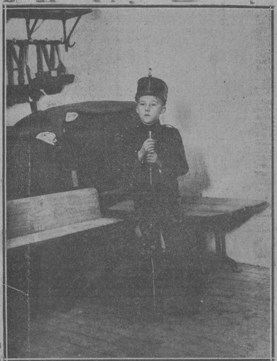
UN RETRATO DE ACTUALIDAD.—Su Alteza Real el infante don Gonzalo vestido de soldado del regimiento del Rey.

El comandante de Marina de Castellón se ha trasladado inmediatamente al Grao, ordenando que el vapor danés «Esland» salga en auxilio del «Mamantios Lenos».