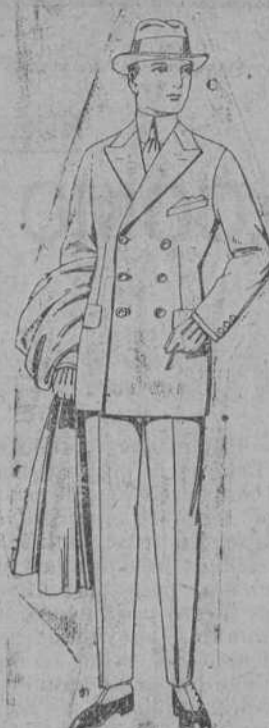
Trajes de cheviot, melton, vicuña e jerga de ptas. 55 a 192.