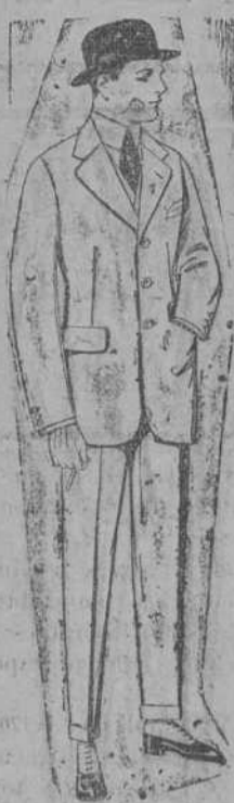
Trajes de cheviot, melton, vicuña o jerga de ptas. 47 a 190.

Sucursales: Madrid, Barcelona, Alicante, Almería, Bilbao, Cádiz, Cartagena, Gijón, Granada, Málaga, Palma de Mallorca, Sevilla, Valencia, Valladolid, Zaragoza.