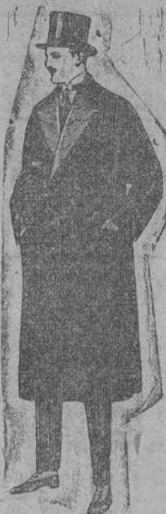
Gabanes de gamuzi o vicuña, con vistas de seda de ptas. 15 a 227.