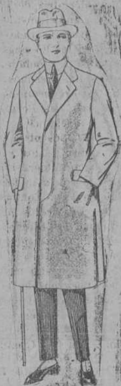
Gabanes de cheviot, gamuza, patén, etc. de ptas. 55 a 70.