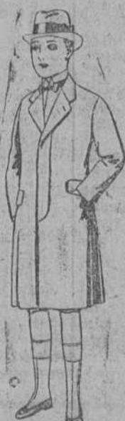
Gabanes de patén, para niños de 10 a 12 años de ptas. 35 a 62.

Precio fijo.—Pídase el catálogo general.—Ventas al contado.