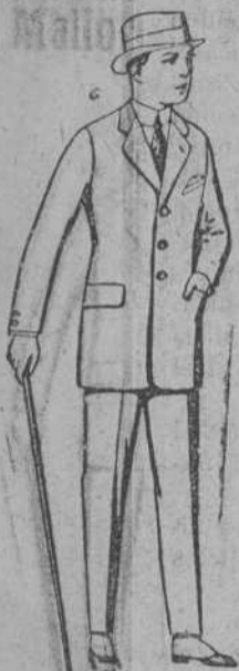
Trajes de patén, vicuña o jerga para niños de 10 a 12 años de ptas. 37 a 83.