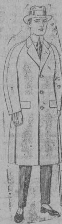
Gabanes de patén, melton o cheviot, con forro de seda, ratón o escocés de ptas. 63 a 185.