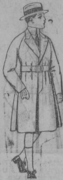
Gabanes de patén, para niños de 4 a 9 años de ptas. 30 a 58.