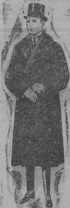
Gabanes de edredón negro, con cuello y vistas de piel de ptas. 229 a 457.