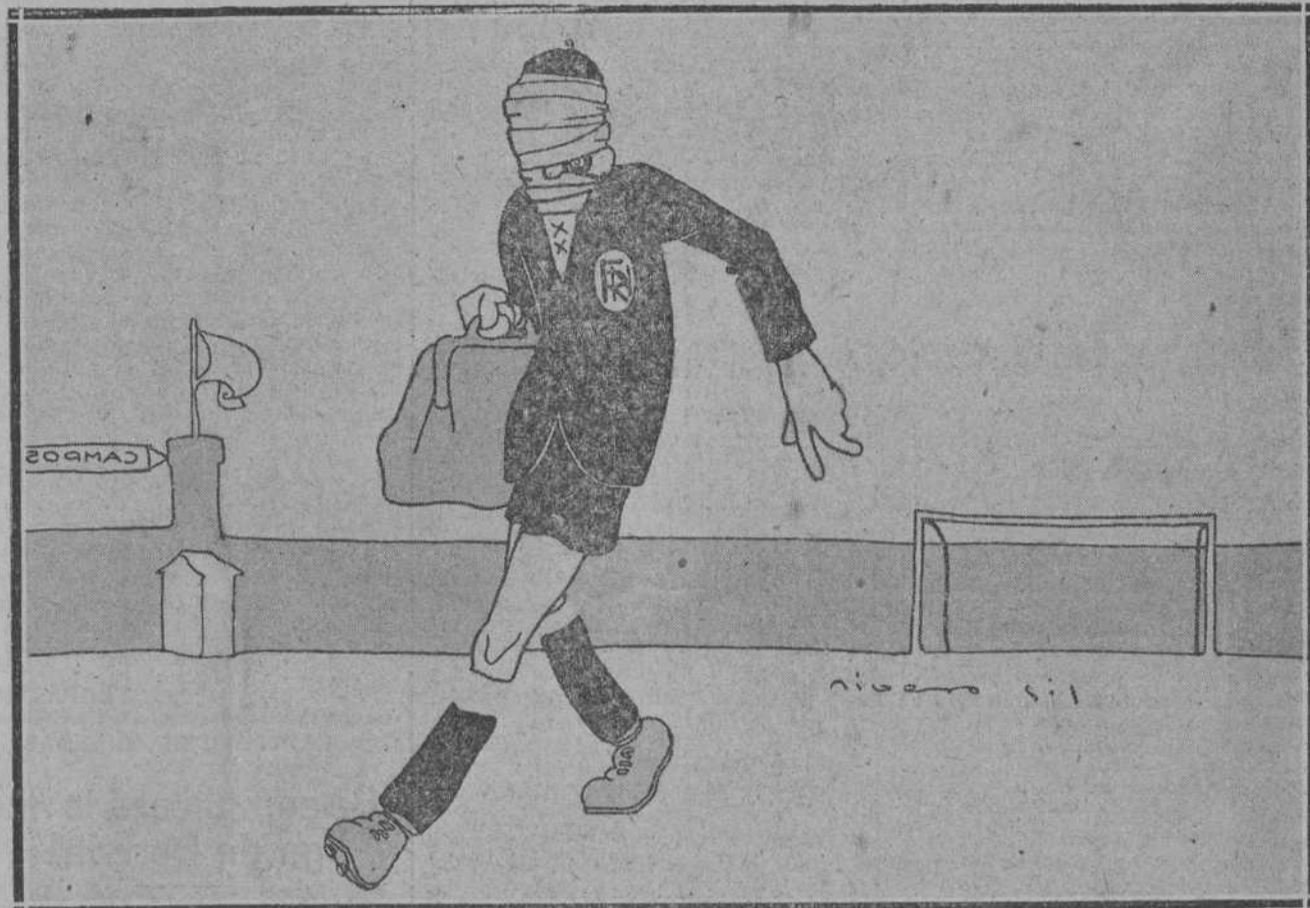
EL «PARTIDO» DEL DOMINGO

siendo extraordinario el número de viajeros, no se sabe si a causa de la novedad.