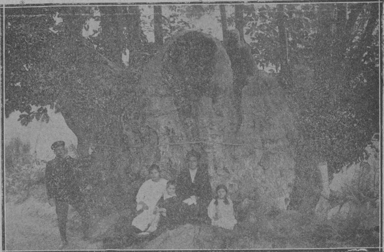
FOR LA PROVINCIA.—GIGANTESCO CASTAÑO—TRECE METROS DE CIRCUNFERENCIA—LLAMADO «LA NAREZONA», EXISTENTE EN CASILLAS-OJEDO.

Policia deteniendo al estafador aludido.