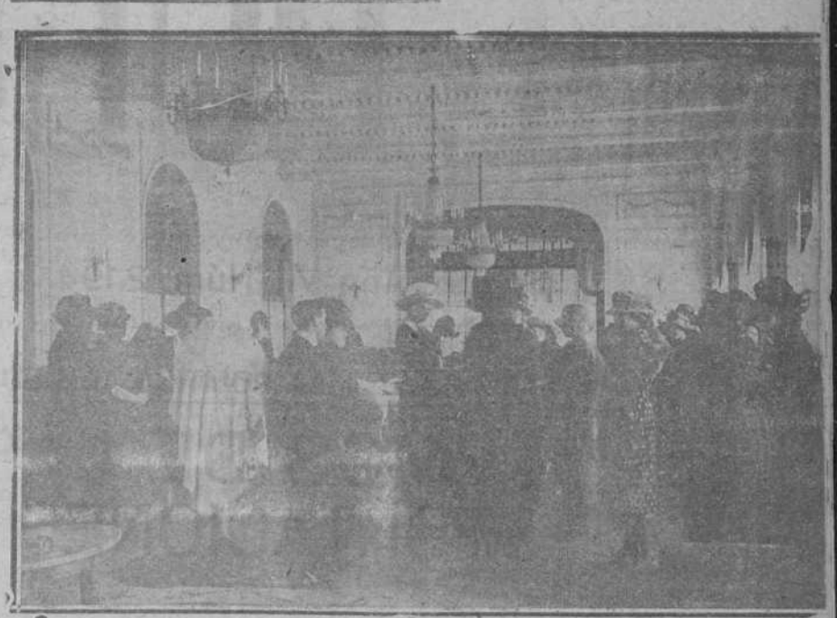
Su Majestad la Reina visitando una exposición de la CASA DUPONS, instalada en el Hotel Real.

Se hacen suscripciones a todos los periódicos y revistas españolas y extranjeras. Los pedidos a la LIBRERIA MODERNA, Viuda de Albira y Díez, BENIGNO DIEZ, sucesor AMÓS DE ESCALANTE, 10.—SANTANDER.