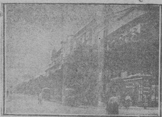
CALLE DE AMOS DE ESCALANTE