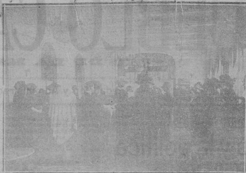
Su Majestad la Reina visitando la exposición de pieles de la CASA DUPONS, instalada en el Hotel Real.