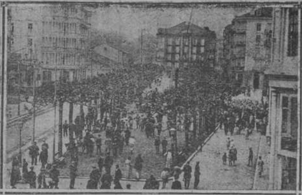
ALAMEDA DE JESUS DE MONASTERIO