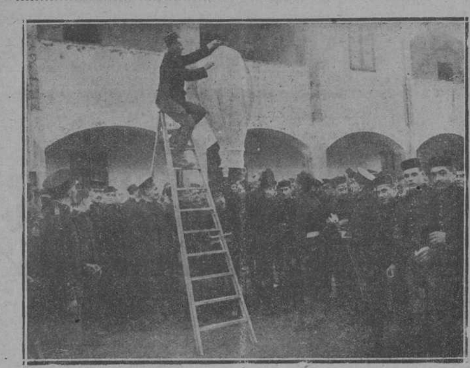
LAS FIESTAS DE SANTA BARBARA. Aspecto del cuartel de artillería, de Santona, durante la elevación de globos.