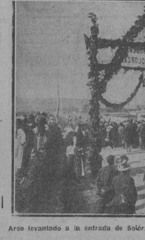
Arco levantado a la entrada de Solórzano con motivo de la visita de los Reyes.

La jornada regia. Lo que hicieron ayer los Reyes. Don Alfonso permaneció la mañana entera trabajando en su despacho, con sus secretarios.