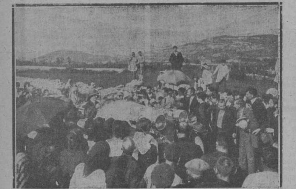
Momento de llegar a Solórzano Sus Majestades los Reyes.

Desde que en Solórzano se tuvo noticia de que los Reyes iban a visitar al insigne estadista en su magnífica posesión, comenzó aquel vecindario a hacer preparativos para recibirlos dignamente, como correspondía a su elevada jerarquía.