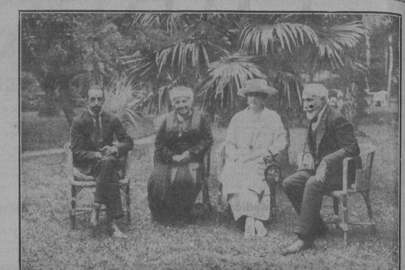
Interesante fotografía de Sus Majestades los Reyes, con don Antonio Maura y su esposa, obtenida ayer en Solórzano por nuestro compañero «Samol», durante la visita que hicieron los Soberanos al ilustre jefe del Gobierno.

Volvió a Palacio a la una y media de la tarde. Su Majestad la Reina doña Victoria salió de la regia posesión de la Magdalena poco después de las once de la mañana, yendo a pie hasta la terraza de la primera playa del Sardinero.