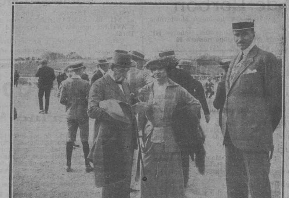
EN EL HIPÓDROMO.—El embajador de Alemania, príncipe de Ratibor, y la princesa de Thurn y Taxis, en el establo del hipódromo de Bellavista.