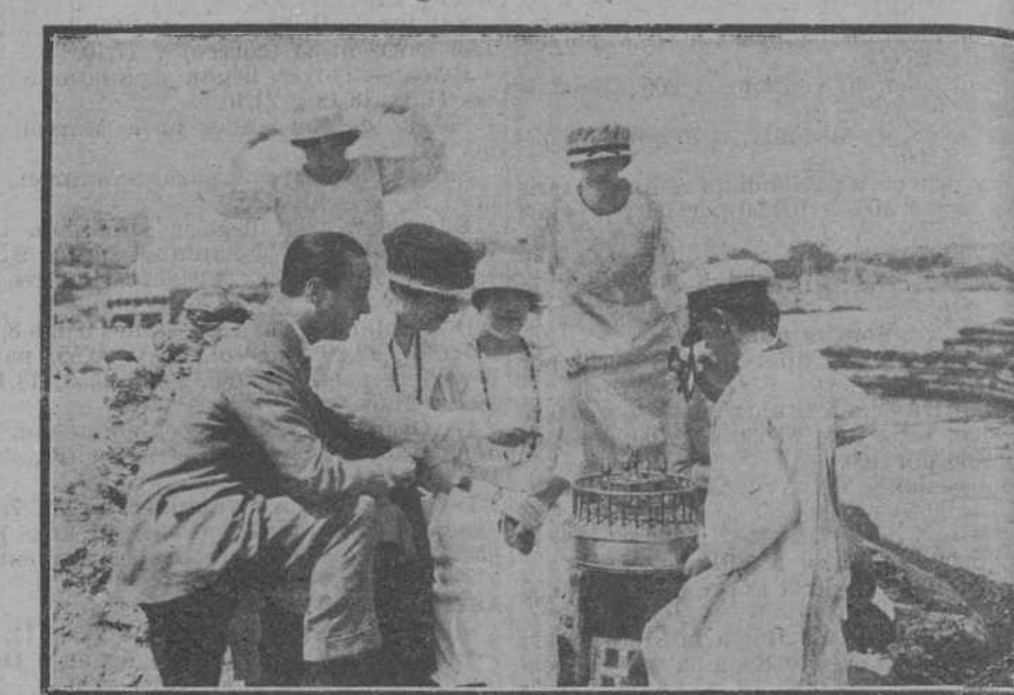
ESCENAS DE LA PLAYA.—Algunas bellas artistas de la compañía del teatro de Lara, jugando a los barquillos en las rocas del Sardinero.

El regreso se dirigió al campo de «tennis» donde jugaron algunos partidos.