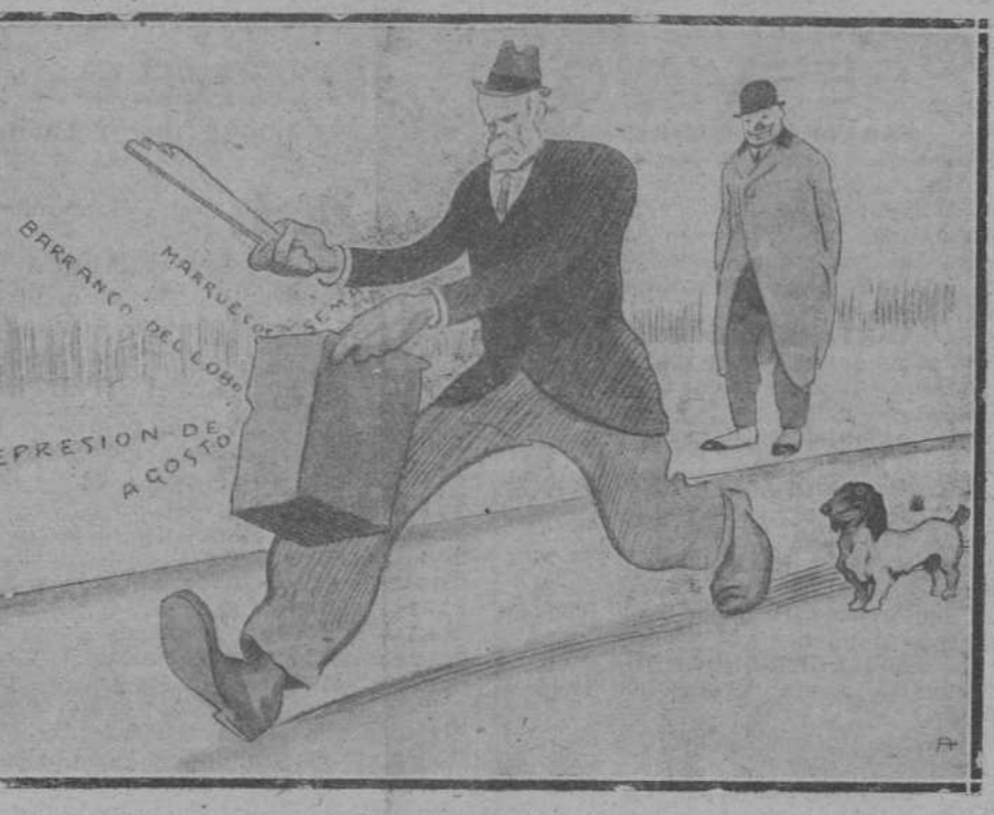
EL DEL CABAN.—Este don Pablo no varia; siempre los mismos golpes a la misma lata.