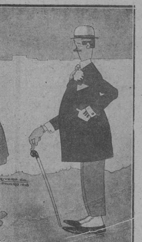
—¿Qué objeto habrá tenido el viaje del ministro de Fomento?— Demostrarnos que hay carbón de sobra y que podemos gartarlo sin (saca).

Hay motivos frente a esta conducta de las imperios centrales para dudar de su buena fe. Los aliados encuentran en la negativa de Alemania a evacuar los territorios ocupados, un argumento, según ellos, irrefutable para probar las aspiraciones anexionistas que en realidad