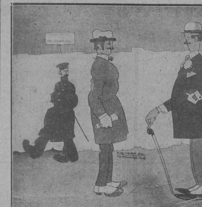
—¿Qué objeto habrá tenido el viaje del ministro de Fomento?— Demostrarnos que hay carbón de sobra y que podemos gartarlo sin (saca).

Hay motivos frente a esta conducta de las imperios centrales para dudar de su buena fe. Los aliados encuentran en la negativa de Alemania a evacuar los territorios ocupados, un argumento, según ellos, irrefutable para probar las aspiraciones anexionistas que en realidad