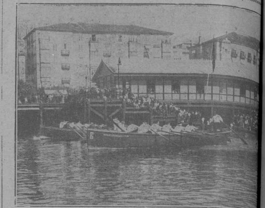
DE LAS REGATAS A REMO.—Las trayectorias en el momento de la salida.

Títular de un artículo en un periódico catalán. «¿Cómo se evitará la subida de la tele?»