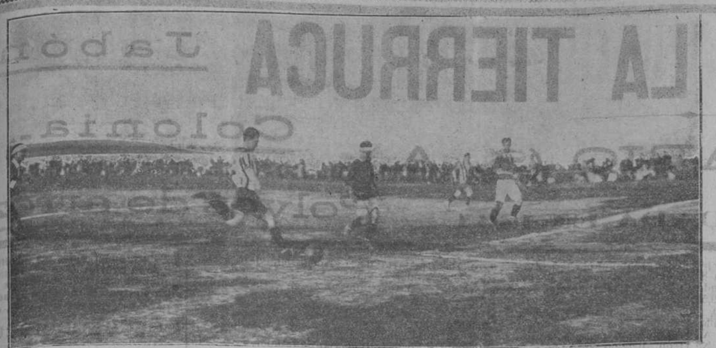
DE FOOT-BALL.—Un momento interesante del partido de ayer en los Campos de Sport.

que esperen, para aplaudir o censurar, a que acabe de deducir las consecuencias de su raciocinio.