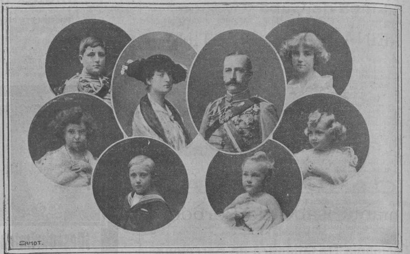
Los infantes don Carlos y don Carlos, y los infantes don Alfonso, doña Isabel, don Carlos, doña Dolores, doña Mercedes y doña Esperanza.

Las reformas del conde del Serrallón fueron la causa directa que condujo con la denominación idónea de nuestro país; veremos si el proyecto del ministro de Ha-