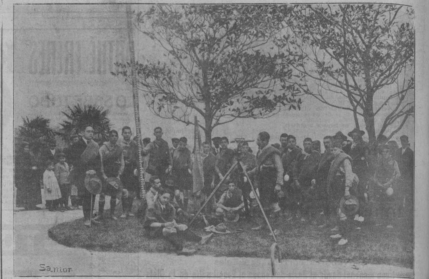
LOS EXPLORADORES EN VALDECILLA.—La sección de topografía.

El Gobierno americano ha abierto una información sobre las ramificaciones de este complot y obrará inmediatamente, si es necesario.