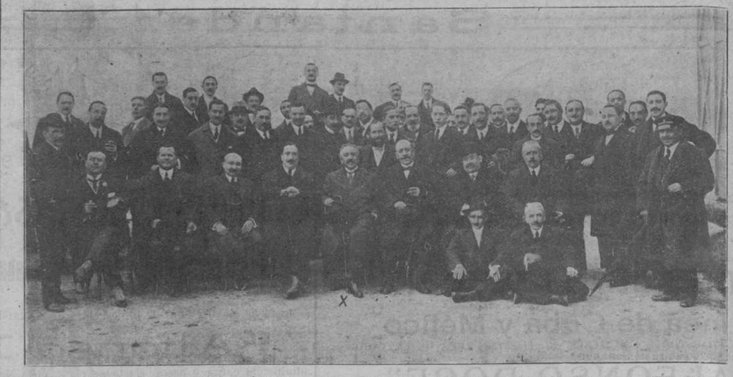
El señor Alcalá Zamora (X) rodeado de los asistentes al banquete que ayer se celebró en su honor.