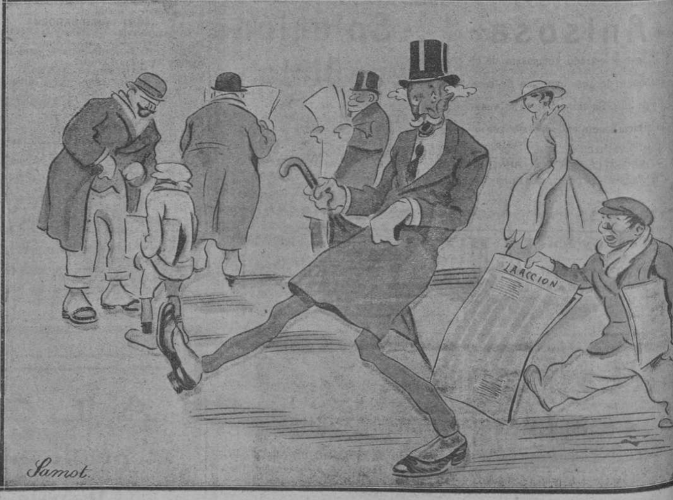
—Señorito, LA ACCIÓN, que viene buena.