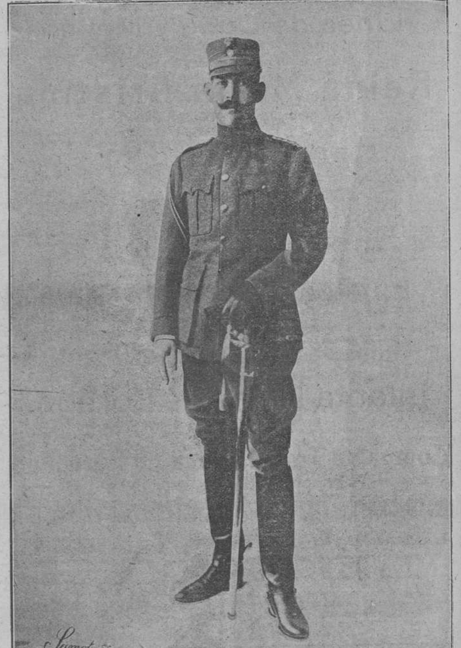
EL REY CONSTANTINO DE GRECIA

El jefe de los socialistas no ocultaba el asombro que le había causado el oír al conde de Romanones un discurso tan ra-