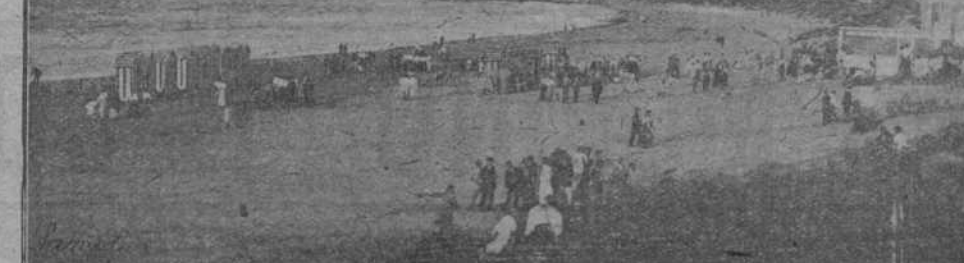
La playa de Berria.

Tal vez una de las instituciones más simpáticas de la población es la que se denomina «Asociación de Caridad Santoneses», establecida con arreglo a las instituciones de este género que vienen funcionando en las principales capitales de