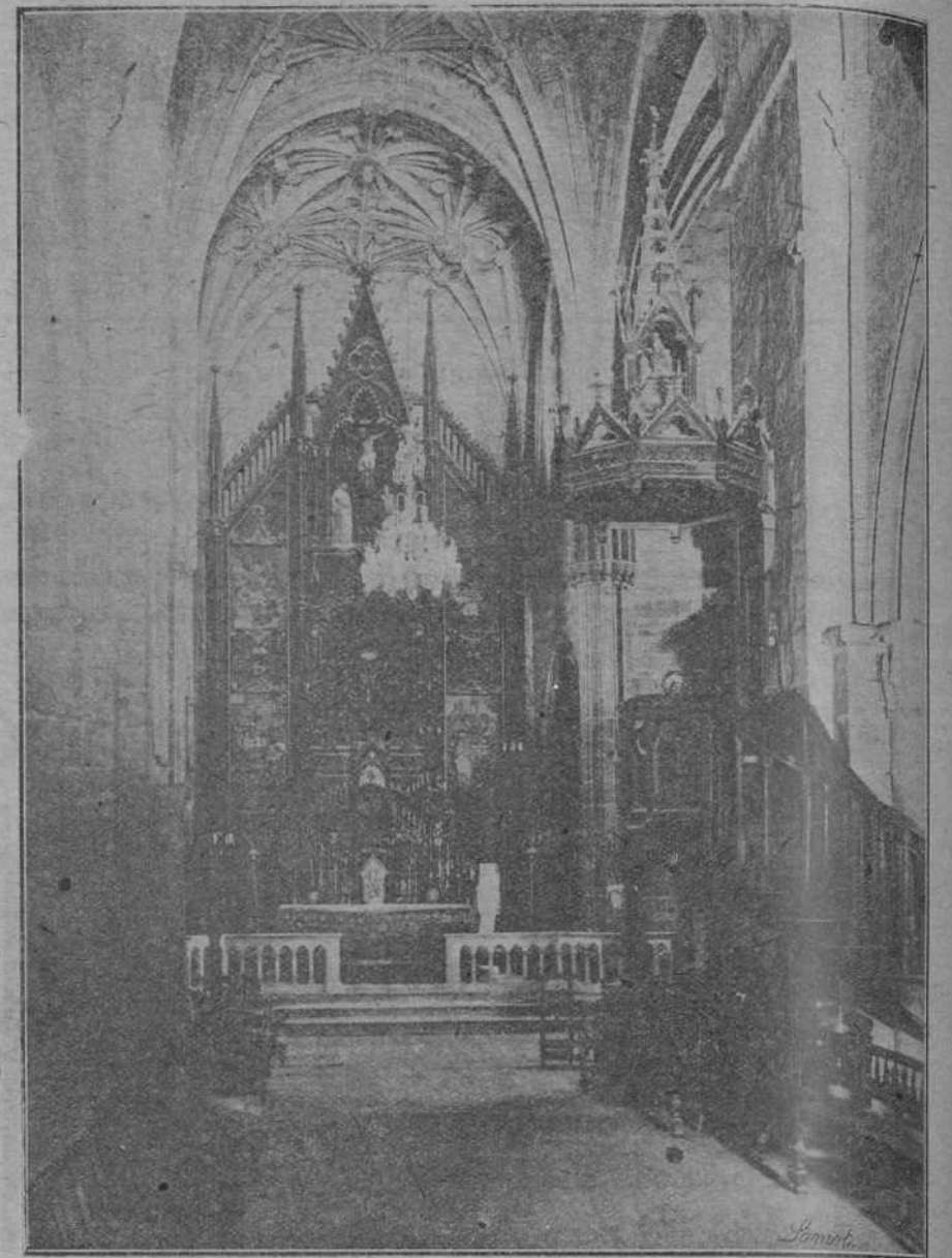
Altar mayor de la iglesia de Nuestra Señora del Puerto.

En su interior hay varias casillas, alquiladas a industriales santoneses, con sus blancos tableros de mármol y anaqueladas pintadas también de blanco, donde se penden todos los artículos de primera necesidad y aun algunos no tan necesarios. Estas casillas o puestos ocupan ambos lados del mercado en su sentido longitudinal, y tienen todos puerta independiente al exterior. En el centro, largos bancos de madera permiten la instalación de puestos de venta de frutas y hortalizas, de las que el mercado santoneses está siempre abundantemente surtido. Exteriormente está el edificio rodeado de una elegante y sólida marquesina de hierro y de zinc, que protege de la lluvia y de los rayos solares a los que allí acuden con sus mercancías y a los que van a comprarlas. Cuenta el mercado abundante instalación de aguas y luz eléctrica, water-closets, etc., y con