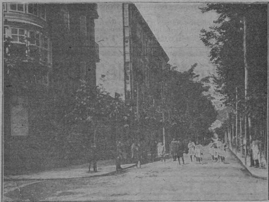
El paseo de Manzanedo.

Todos los desarreglos del APARATO DIGESTIVO se corrigen y curan con los comprimidos ESCOBAR LOPEZ. Pídase en farmacias y centros de especialidad.