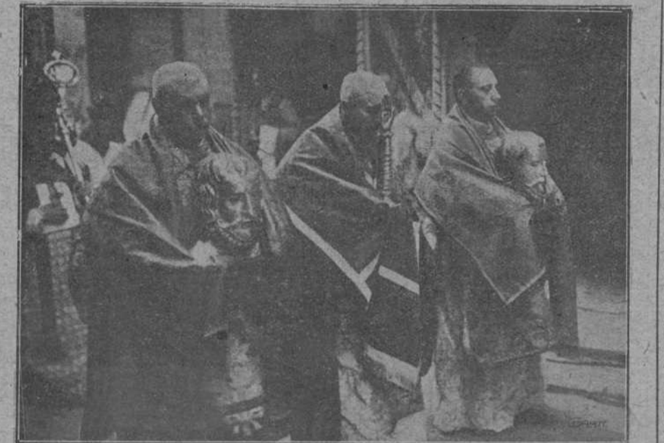
LA FIESTA DE LA PROVINCIA - LAS RELIQUIAS DE SAN EMERITO...