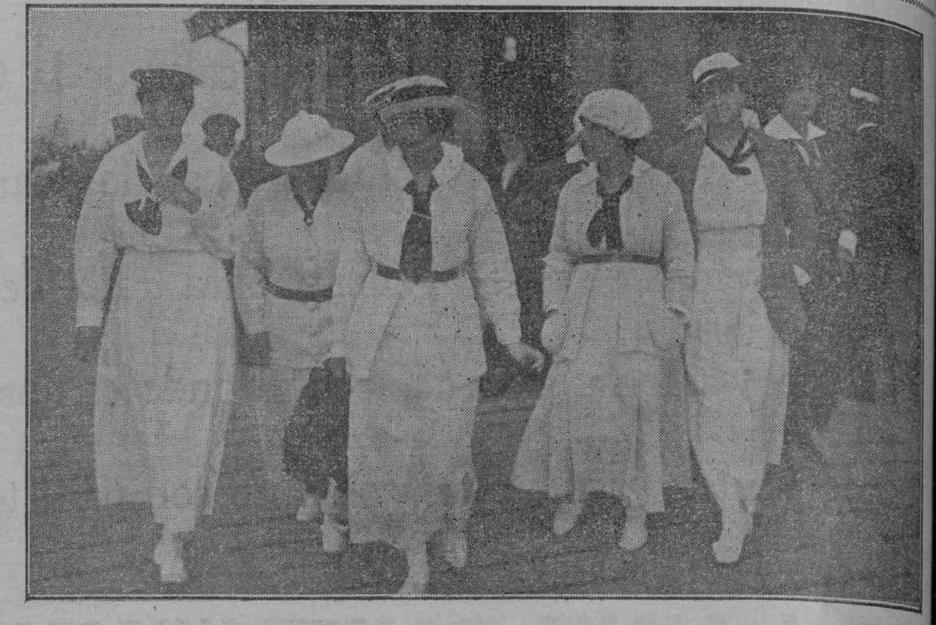
LOS BALANDRISTAS SALIENDO DE LA CASETA DE PASAJEROS DESPUES DE SUSPENDERSE LAS REGATAS

A las cuatro y cuarenta y cinco de la mañana han quedado ocupadas las nuevas posiciones, ofreciendo el enemigo al principio bastante resistencia, que fué vencida por fuerzas de la Policía indígena, apoyadas por fuerzas del ejército.