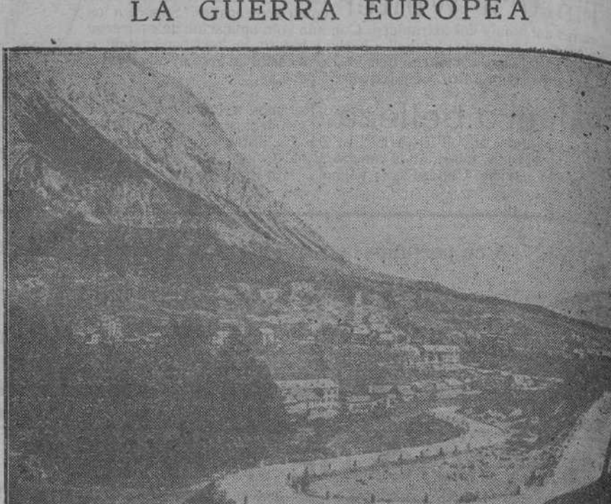
VISTA DE CORTINA D'AMPEZZO, EN EL TRENINO, OCUPADA POR LOS ITALIANOS

Durante la noche del 17 un aeroplano austriaco lanzó una bomba sobre un tren sanitario en la estación de Carmaus, resultando herido el maquinista.