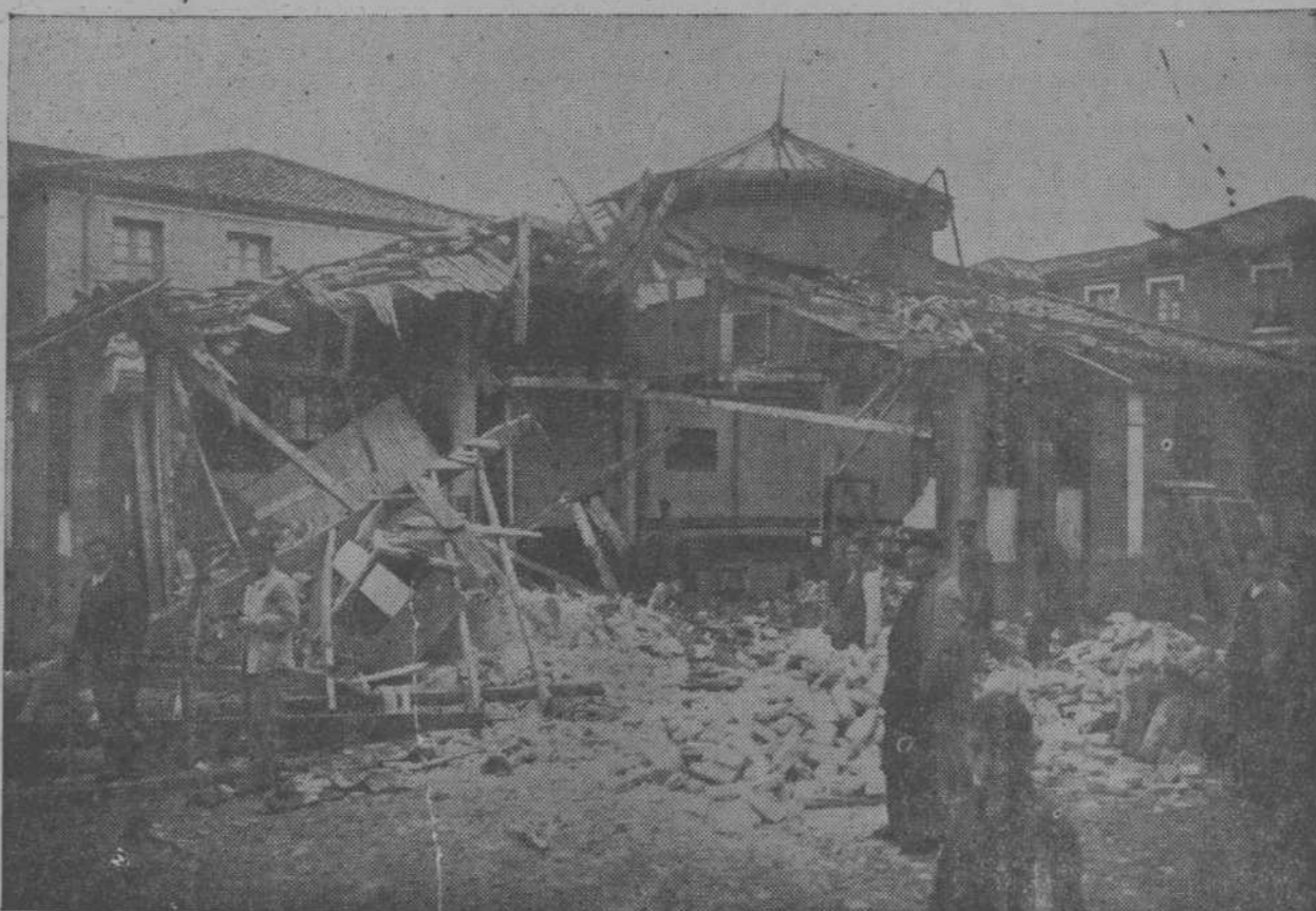
Huellas del atentado fascista del domingo. Escombros, ruinas y muerte sembraron a su paso los aviones facciosos; he aquí un lugar perteneciente a una de las zonas más castigadas por el bombardeo.

Milicias y republicanos todos, calma, serenidad y justicia noble.