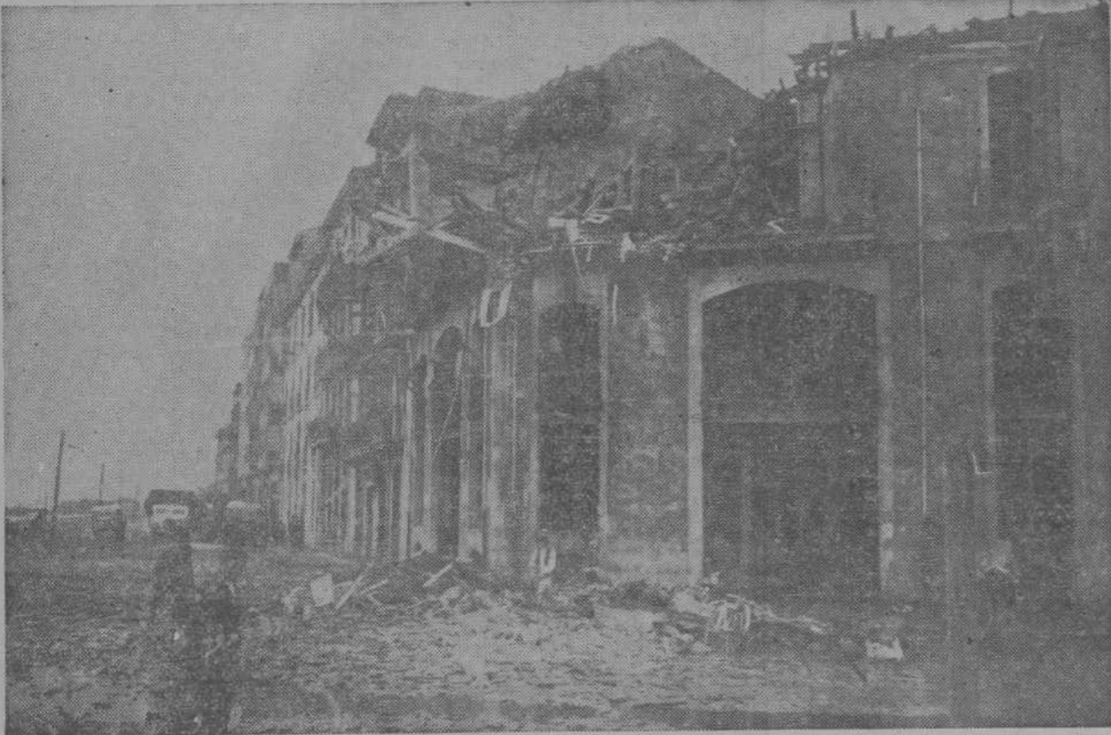
Ajenas e indelencas de la agresión criminal que iban a sufrir, numerosas personas sufrieron en esta zona de la capital los asesinos efectos de la metralla. De esos escombros como de tantos otros de la ciudad, sólo se levanta una voz de asco y de desprecio para los causantes de tales horrores. (Fot. Alejandro).