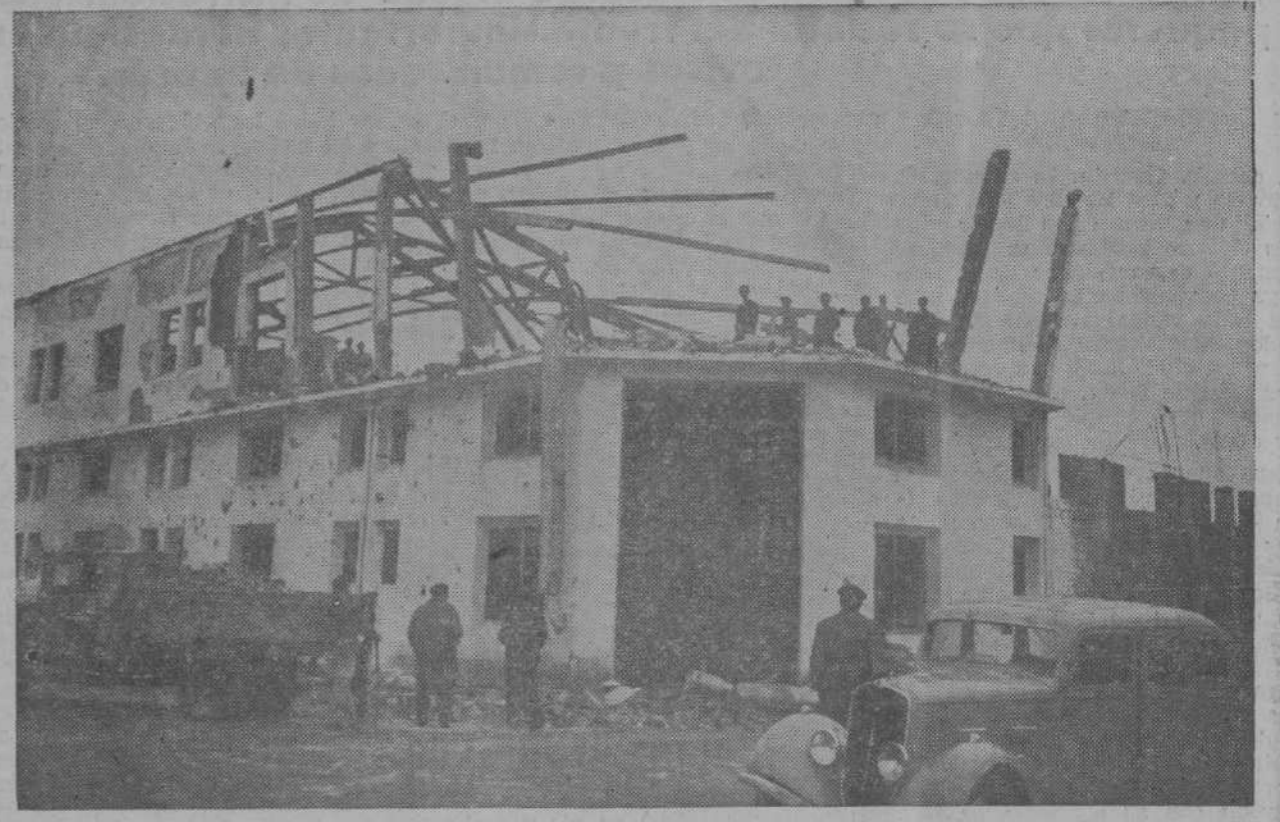
Son numerosos los barrios en la ciudad que muestran bien a las claras a todos, los horrores de la agresión. He aquí una moderna y sólida construcción demolida en un instante por las bombas de la aviación rebelde.