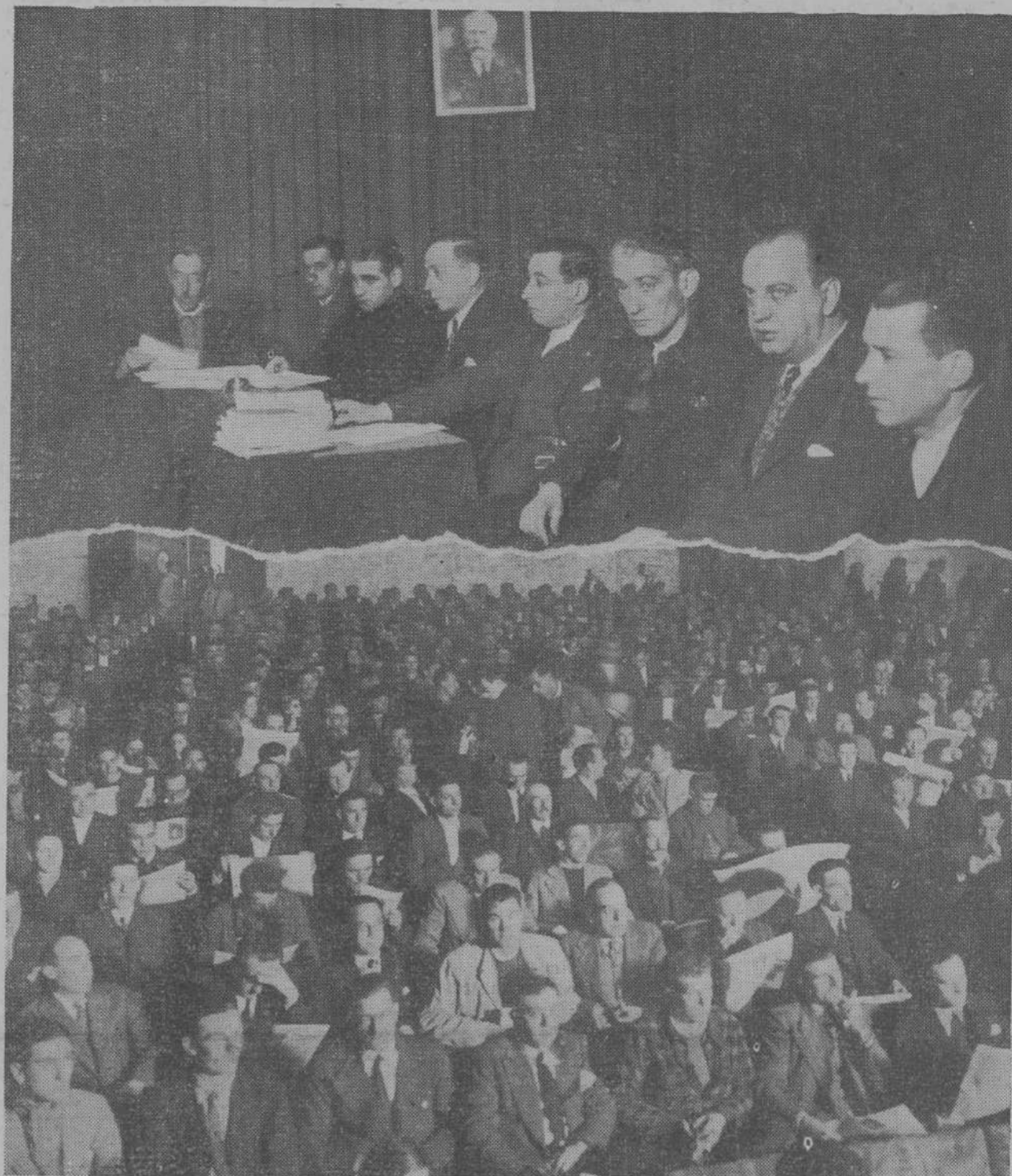
EL PLENO DE LA FEDERACION OBRERA MONTAÑESA.—Ayer se celebró en el Gran Cinema una Asamblea de la Federación Obrera Montañesa. Arriba, la presidencia del Congreso. En la parte posterior, un detalle de la sala.

Una vez más, la Unión General de Trabajadores convocó sus Juntas directivas para la celebración de una importantísima Asamblea extraordinaria para la discusión, examen y aprobación de un orden del día ya publicado en la Prensa local.