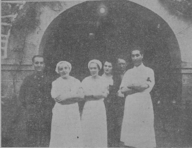
LANESTOSA.—Hóspital de sangre de la Cruz Roja.—Personal facultativo y administrativo, cuyos servicios han merecido los elogios del Comité local.

En nuestras crónicas de días pasados dábamos cuenta de las visitas a los hospitales de sangre de Santoña y La Aparecida. Con la de hoy sobre los instalados en Lanestosa y La Gándara, terminamos la descripción de los existentes en la parte este de la provincia.