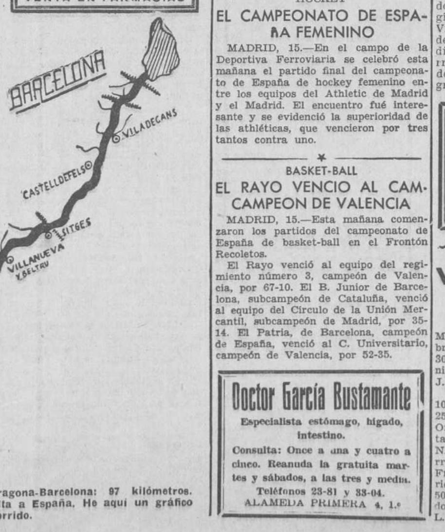
Hoy se corre la décima etapa, Tarragona-Barcelona: 97 kilómetros. Es decir, la etapa chica de la Vuelta a España. He aquí un gráfico del recorrido.