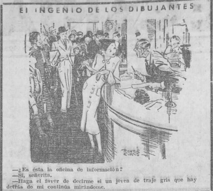
— ¡Es ésta la oficina de información? — Sí, señorita. — Haga el favor de decirme si un joven de traje gris que hay detrás de mí continúa mirándome.