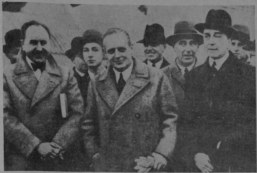
El señor Ribbentrop (en el centro), jefe de la Delegación de Alemania en el Consejo de la Sociedad de Naciones, a su llegada a Londres, para asistir a la reunión en que en definitiva se reconoció la violación del Pacto de Locarno por parte de Alemania.

Por lo demás, Sancho es una figura interesante. Sancho, en el mundo ideal, es un personaje tan grande como don Quijote. Sancho, en el mundo real, es un personaje tan pequeño como don Quijote. Sancho, en el mundo ideal, es un personaje tan grande como don Quijote. Sancho, en el mundo real, es un personaje tan pequeño como don Quijote. Sancho, en el mundo ideal, es un personaje tan grande como don Quijote. Sancho, en el mundo real, es un personaje tan pequeño como don Quijote.