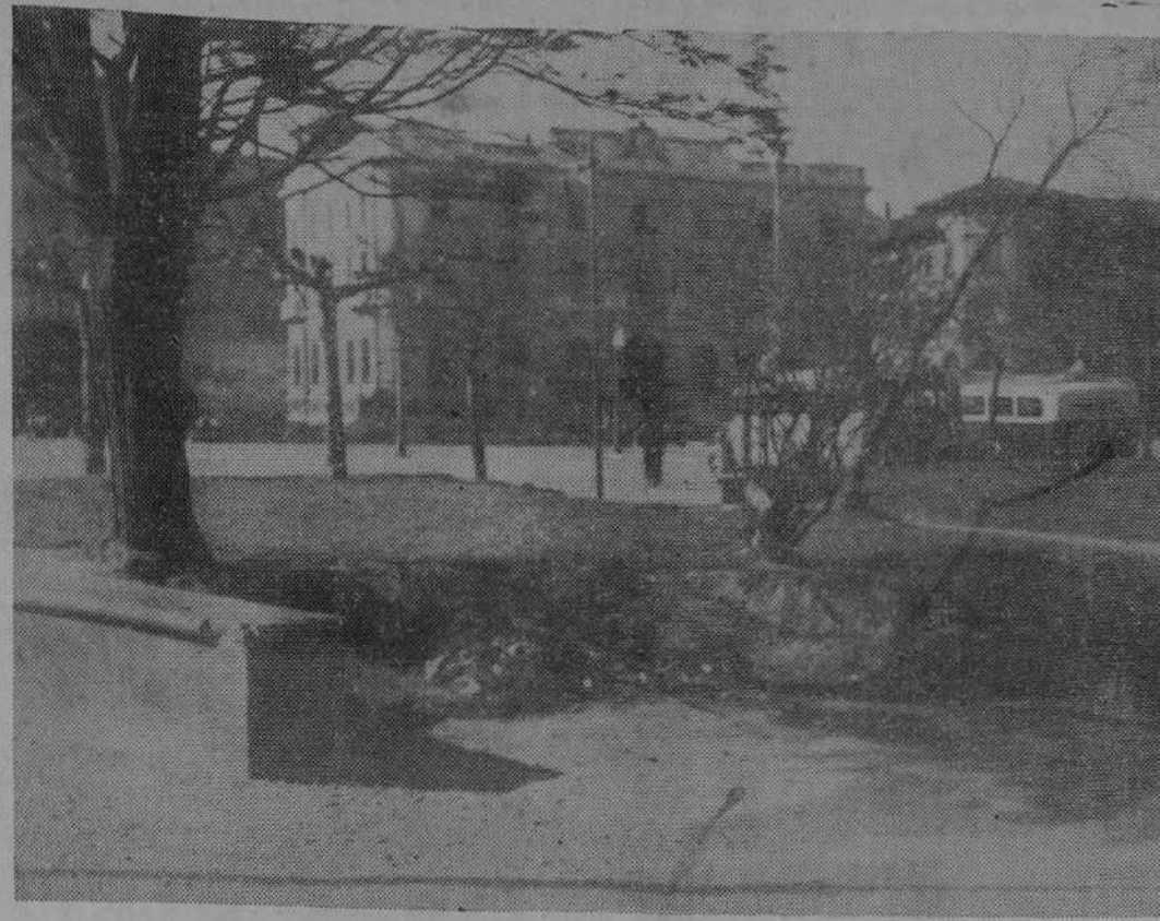
Desemboca un turista en Santander, se da un paseo con Celestino Traseunte y en el centro de la ciudad, en los jardines de Pereda, puede observar ese montón de basuras que día tras día adquiere volumen y extensión... ¿No podría el señor alcalde hacer que se cambiase de sitio ese estercolero, que pone a Santander a la altura del pueblo más insignificante de España? Esperemos.

Elegantísimos impresos en EDITORIAL MONTAÑESA Dr. C. AGUILERA ENFERMEDADES DE LA PIEL Y VENEREAS Jefe clínico del Dispensario Oficial Antiveneréico de Santander. Consulta de 12 a 2 y de 4 a 6. Años de Escalante, 2, segundo Teléfono 28-36.