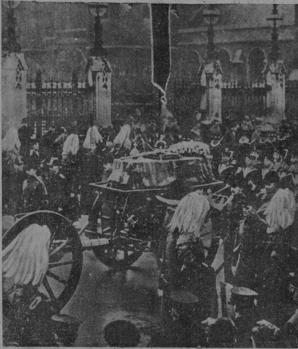
DEL ENTIERRO DEL REY DE INGLATERRA.—El arnés de artillería, que conducía los restos de Jorge V, tirado por ciento cuarenta y dos marinos, al ponerse en marcha en Westminster Hall.

Para muebles, visite almacenes RIBALAYGUA