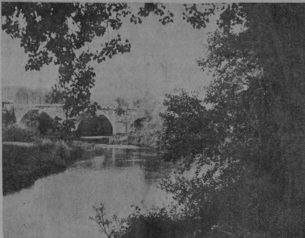
LA MONTAÑA, REGION DE TURISMO.—Un bello rincón del Pas.