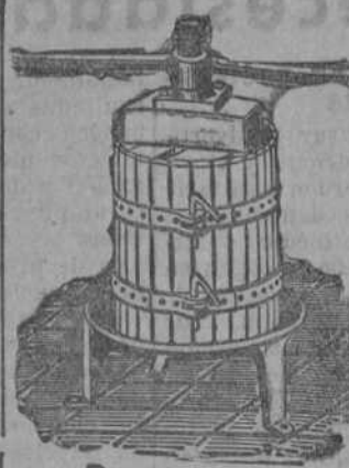
Prensas para uva y manzanas desde 70 Ft. Estrujadoras para uva.

DESDE 15 PESETAS vuelvo trajes, gabanes; reformo vuelvo fracs, smokings, uniformes, trincheras. Quedan nuevos. Segismundo Moret, 12, segundo.