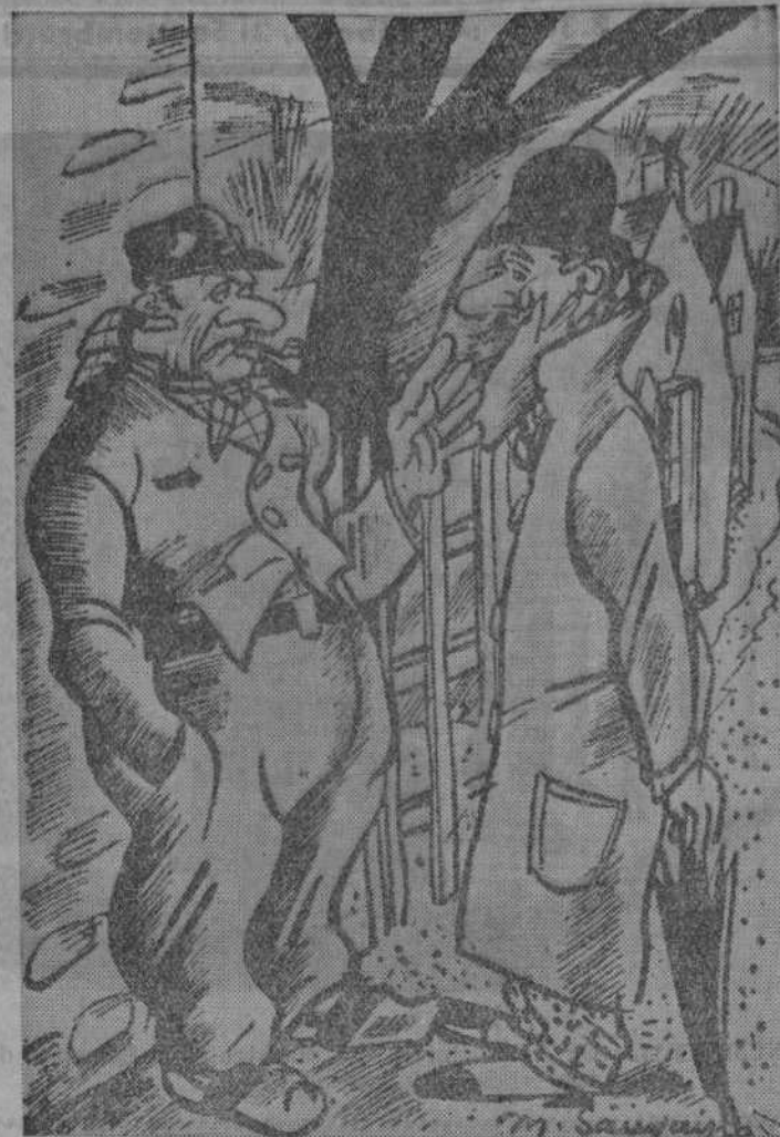
—La nueva línea del ferrocarril local pasará precisamente por el centro de su corral. —¡Ah! ¿Y usted se cree que yo voy a abrir la puerta cada vez que...?