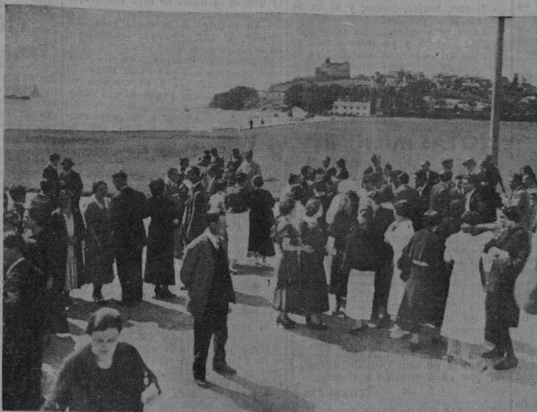
EN LA UNIVERSIDAD INTERNACIONAL DE VERANO.—Ayer se verificaron en el Auditorio de la Magdalena los exámenes de los maestros cursillistas. La «foto» de Alejandro recoge uno de los momentos, después de celebrados los exámenes, en que los maestros comentan mientras esperan impacientes el fallo del Jurado examinador.

Segunda parte «La guitarra de Figaro»; Soneto; «La del manojito de rosas», selección; «Sanjón de la Virgen», zambra; «Brisa de Málaga», zambra; «Brisa».