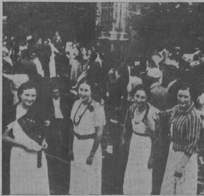
El bello rincón de Miera, donde todavía se conserva íntegro todo el tradicional tipicismo de los viejos tiempos, ha celebrado su fiesta patronal de San Mateo con una alegría inusitada. La foto recoge uno de los momentos de la pacífica fiesta en la consabida plaza pueblerina, adornada en este día por ese grupito de bellas romeras merachas que con sus semblantes de juventud y alegría retan al objetivo..