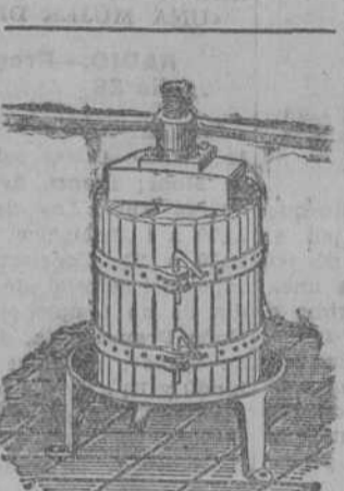
Prensas para uva y estrujadoras para uva. Pida catálogo a Víctor Gruber y Cia., Lda.

AUSTIN SPORT, dos plazas, matrícula sobre el cinco mil, 2.400 pesetas. Informarán Café Namur.