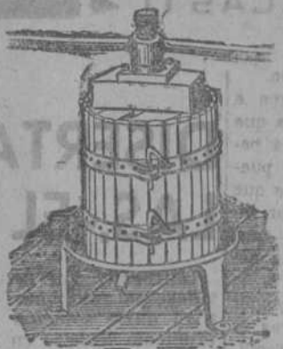
Prensas para uva y manzana desde 70 liras. Estrujadoras para uva...