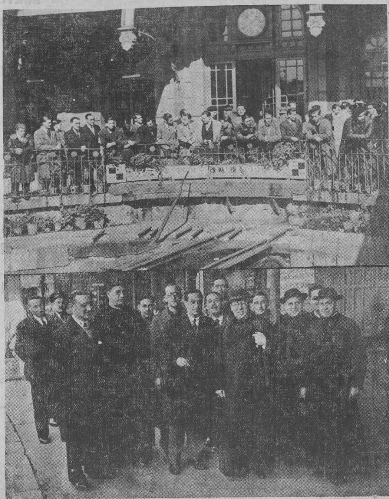
Ayer emprendió viaje a Roma un nuevo núcleo de católicos montañeses. Esta expedición la preside el señor obispo, doctor Eguino y Tregu. Las fotos recogen un grupo de jóvenes católicos, que se dirigen a la Ciudad Eterna, y al obispo de la diócesis, en el arden de la estación de Cantabria, momentos antes de partir el tren.