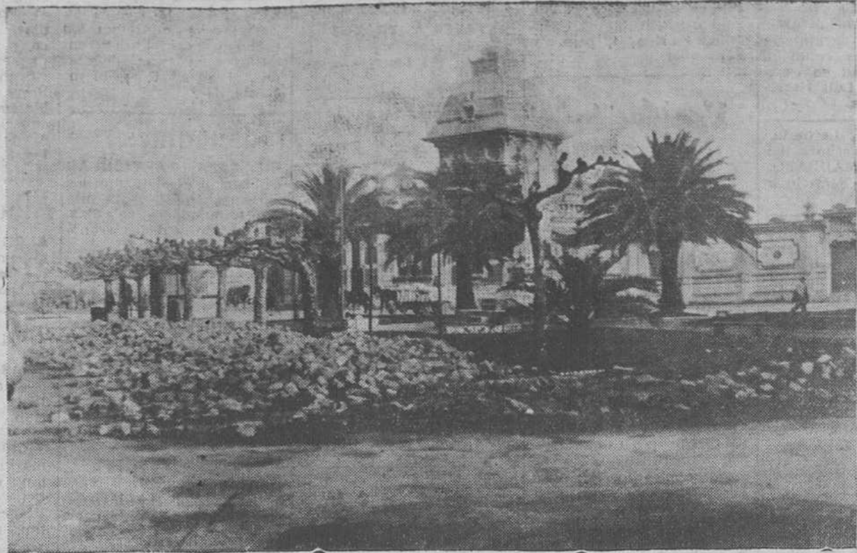
Estampas poco vistosas, digámoslo con franqueza... y con una demostración gráfica tan convincente como la presente "foto". Se trata de la plaza del Machicho en la parte cedida por el Ayuntamiento para que sea construido el edificio de la Diputación. Pero como la gran cantidad de piedra allí amontonada no está destinada a dicha construcción y sí, por lo que se ve, a dificultar el tránsito y a afeear un lugar tan visible como éste, nos parece que el Ayuntamiento debe proceder "en consecuencia", como se dice en los expedientes. ¿A que todos los demás santanderinos piensan igual?

ralmente antes en la cantidad de dinero a gastar que con la inversión de estos capitales; y 4.º Porque concebidas todas las obras con criterio de partido, la crisis política trae aparejada la paralización de unas obras que sólo responden al criterio personal que abandona el ministerio.