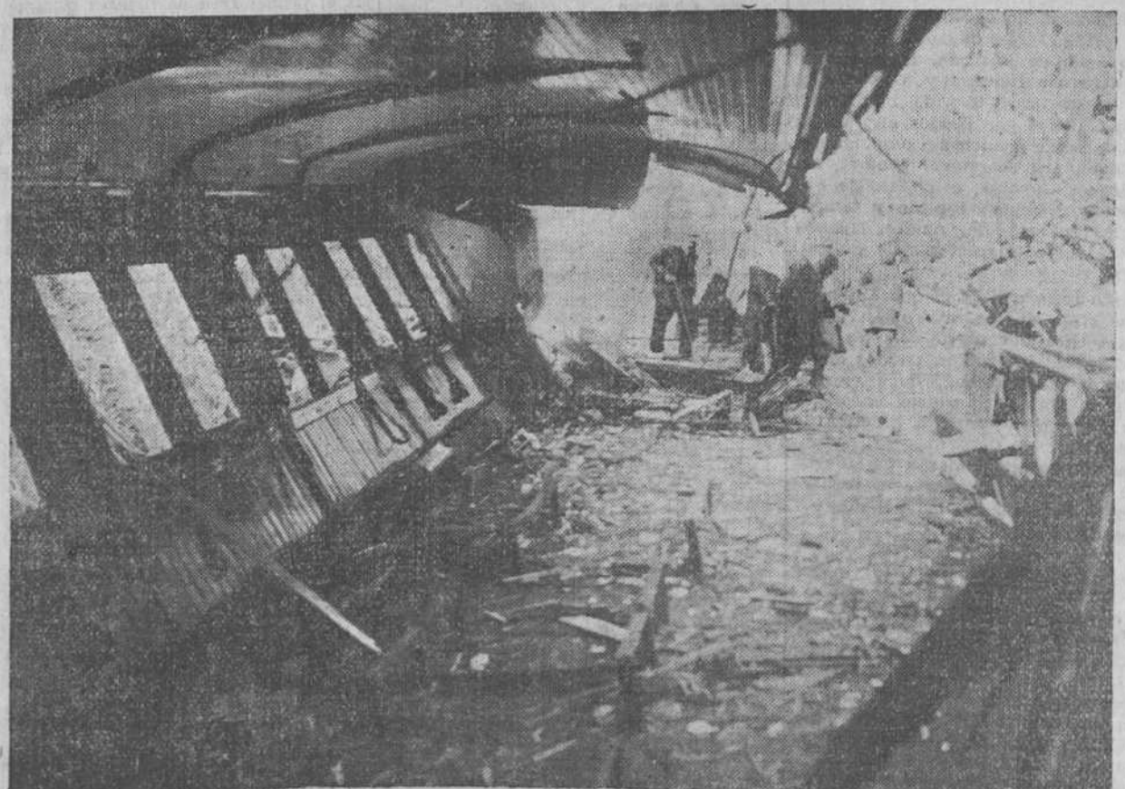
Impresionante aspecto del interior del coche de tercera, en que fueron hallados el guardia de Asalto, muerto, y varias personas más, heridas.