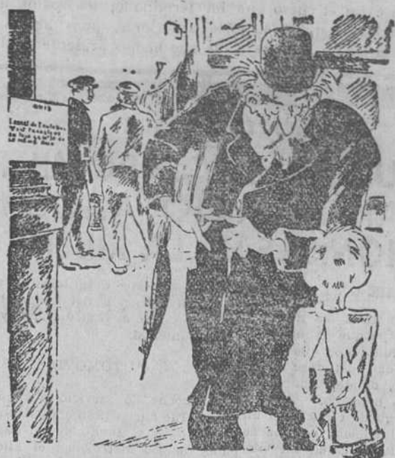
EL PROFESOR (que ha olvidado las gafas).—Pequeño, ¿quieres leerme lo que dice ese anuncio? EL MUCHACHO.—Lo siento mucho, señor, pero yo tampoco sé leer.