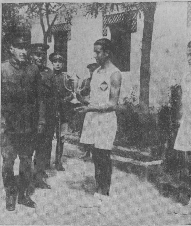
EN MADRID.—En el campamento de Carabanchel y por el general Cabanellas se hizo entrega de un valioso trofeo al equipo artillero que últimamente hizo a pie el viaje Madrid-Barcelona.