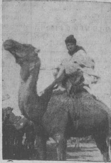
Algunas veces tenía Navamuel que vestirse de moro, encaramarse sobre un camello y seguir rutas penosas por el desierto...

El bravo aviador toma unos sorbos de coñac, y nos plantea a continuación una cuestión previa, con cariñosas salvedades para nuestra discreción: —Hay muchas razones trascendentales para que establezcamos en nuestra conversación algo así como una pared divisoria entre lo que yo diga y lo que usted deba escribir. Conviene al interés de la buena causa que defendemos. En horas de sacrificio, al periodista le toca hacer el inmenso—yo lo comprendo bien—de guardar en su libro de notas, hasta el momento oportuno, acaso los detalles de mayor importancia de esta información. Pero, repito, nos lo exigen nuestros deberes de patriotas. —Sea por ellos. Hable usted.