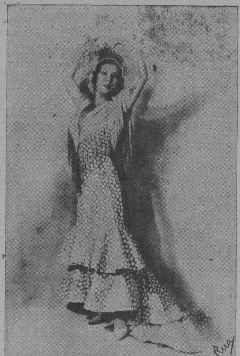
Erguido el cuerpo, altos los brazos, los ojos vivos, La Argentinita se dispone a entrar en escena. Será la "Candelas" hechizada de "El Amor Brujo", la obra inmortal de Falla. La Argentinita es la más fiel interprete de nuestro

EL GRAN TEATRO DEL MUNDO ¡Ah, el gran teatro del mundo! ¡Mil veces más trágico y emocionante que éste, ficción, que desarroja su acción sobre escenarios, entre las bambalinas mentirosas. Esto pienso yo es piando ocultamente la sala desde este agujero alejoso del telón de boca. Desde este miradero escondido sorprende la gran farsa del mundo. ¡Todos con su careta! Con su careta de disimulo. ¡Ahí está ese casado a quien dominan los gritos de la mujer. Y la dama que empaña la honestidad del hogar conyugal. Y la jovencita que sufre desdenes de amor. Y el empleado que subvierte los fondos del principal. Y el estudiante que engaña la buena fe paterna. Y el que sufre los fieros ahogos de la necesidad. ¡Todos con la careta de disimulo! Carátula del comediante sobre sus problemas, sobre sus angustias, sobre sus vicios. Carátula maravillosa que hace posible la sociabilidad humana. Piden los necios la sinceridad de la vida.