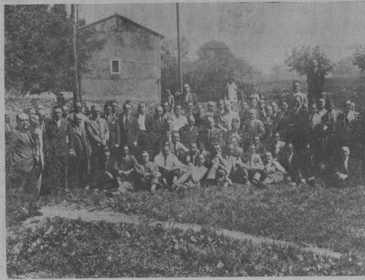
Los viajeros y representantes cantanderinos celebraron ayer su fiesta profesional. Asistieron a una misa en sufragio de un compañero fallecido y a mediodía se reunieron en fraterno banquete en "La Vizcaina". La "foto" reproduce el grupo de asistentes a la simpática fiesta de compañerismo y solidaridad.