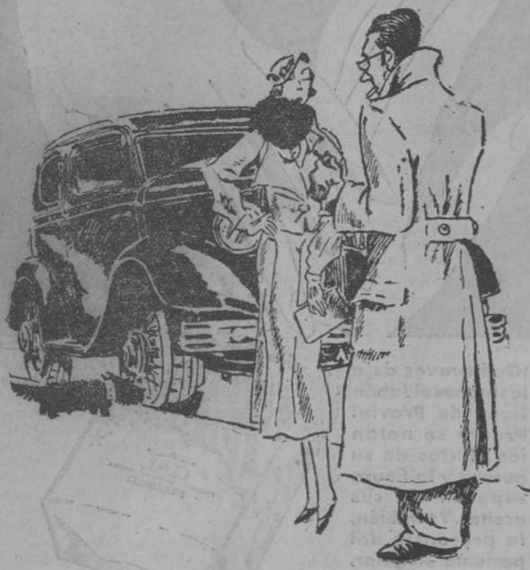
ALGO DE LOGICA

—En América, según las estadísticas, hay un "auto" por cada tres habitantes.