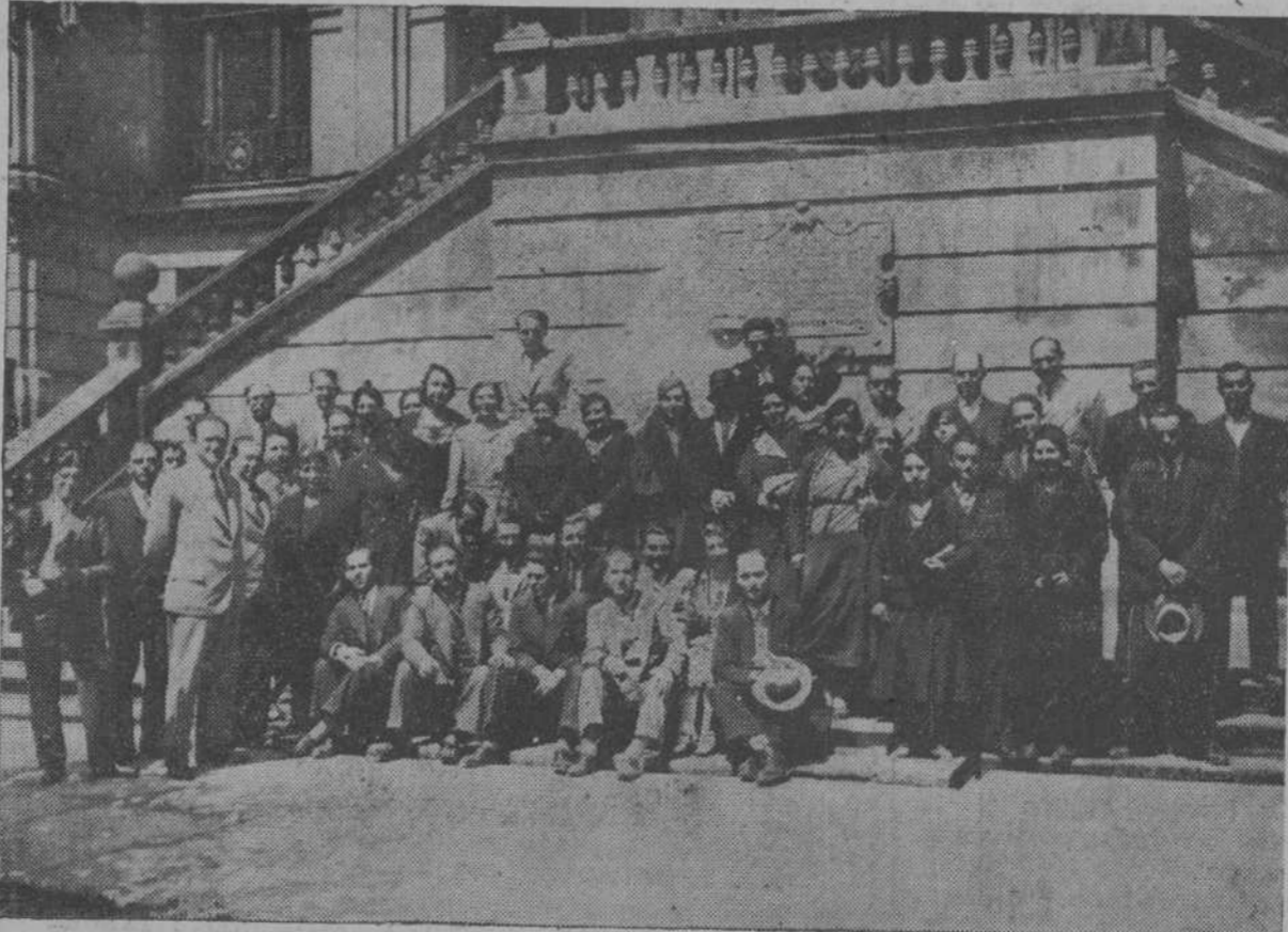
Los distinguidos maestros y maestras que asisten al curso de perfeccionamiento al salir ayer de visitar las bibliotecas municipales.