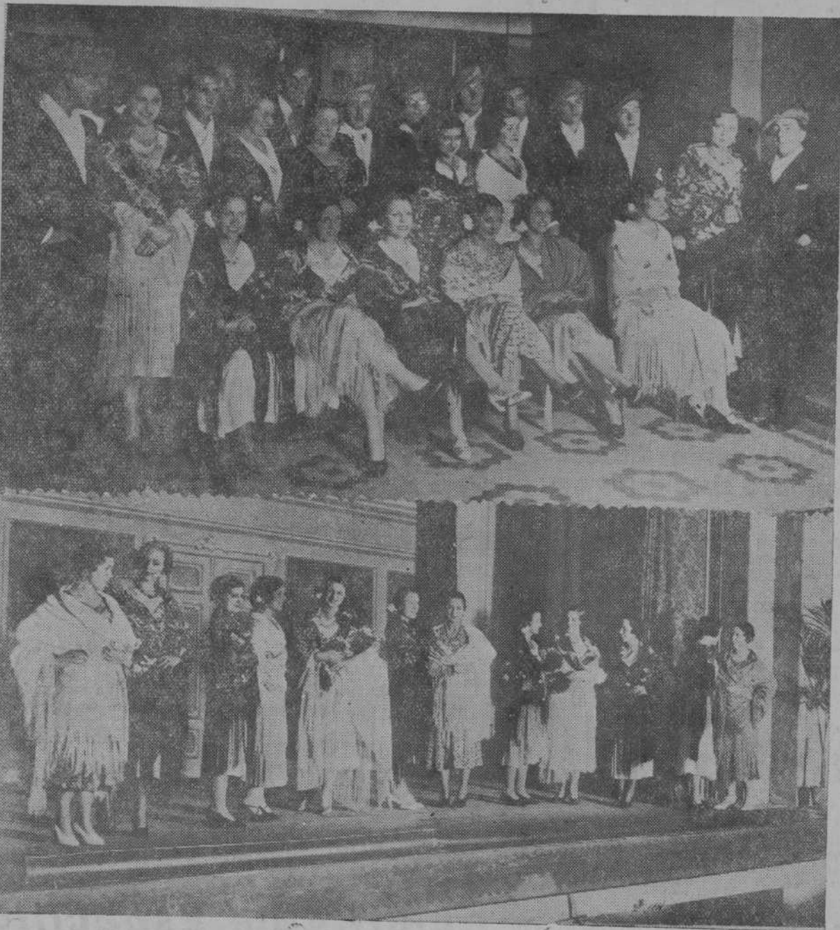
Un grupo de bellas muchachas y animosos jóvenes que sienten un decidido fervor por el arte escénico nacional, ha celebrado ayer en el Salón Victoria la IV Jornada de Arte con un positivo éxito. He aquí dos sugestivas fotografías de los notables aficionados.