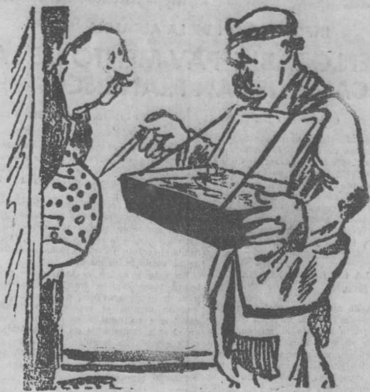
—Caballero, compre usted una magnífica plegadera para abrir las cartas. —No la necesito. Soy casado.