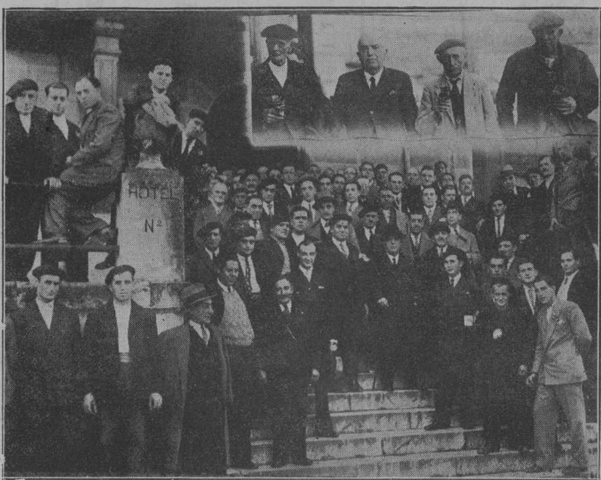
Concurrentes al banquete celebrado el domingo por la Asociación de Empleados y Obreros municipales. Arriba, el alcalde con los tres ancianos jubilados, a quienes se hizo objeto de un cariñoso homenaje.

Bien sinceramente lamentamos que el exceso agobiador de original de que disponemos para este número nos impida dar a esta información la ampliación que merece.