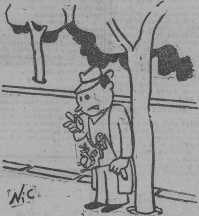
EL ENAMORADO QUE ESPERA