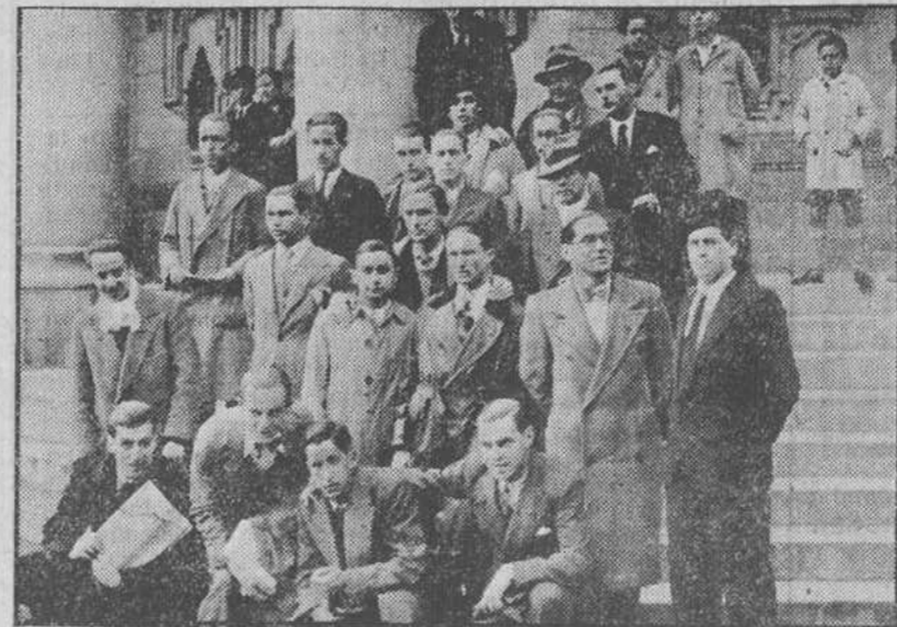
Los estudiantes de Derecho de la Universidad de Oviedo, que en viaje de estudios se hallan en Santander, al disponerse a salir para Santoña con objeto de visitar la Colonia Penitenciaria del Dueso.